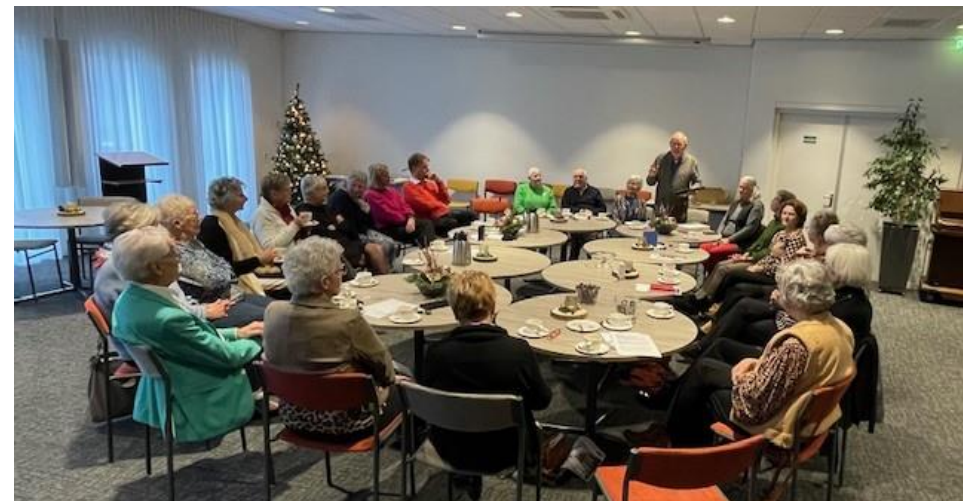
Jaarafsluiting in de Klokkenkamp te Goor