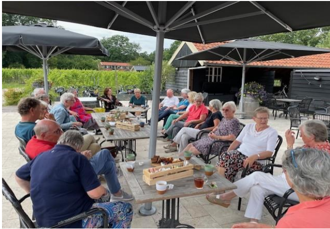
Jaaruitje bij Wijngaard Hof van Twente