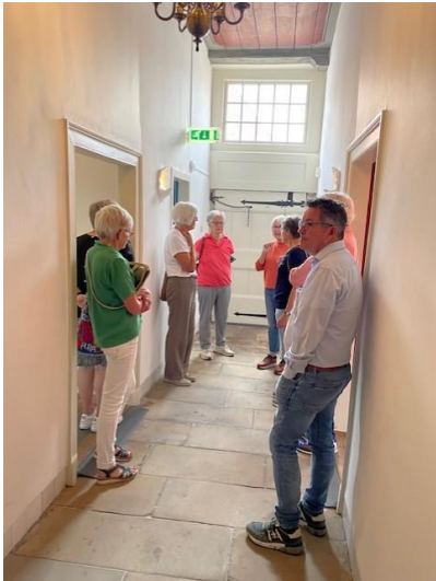
Jaaruitje bij het Palthe museum en Erve Hulsbeek te Oldenzaal